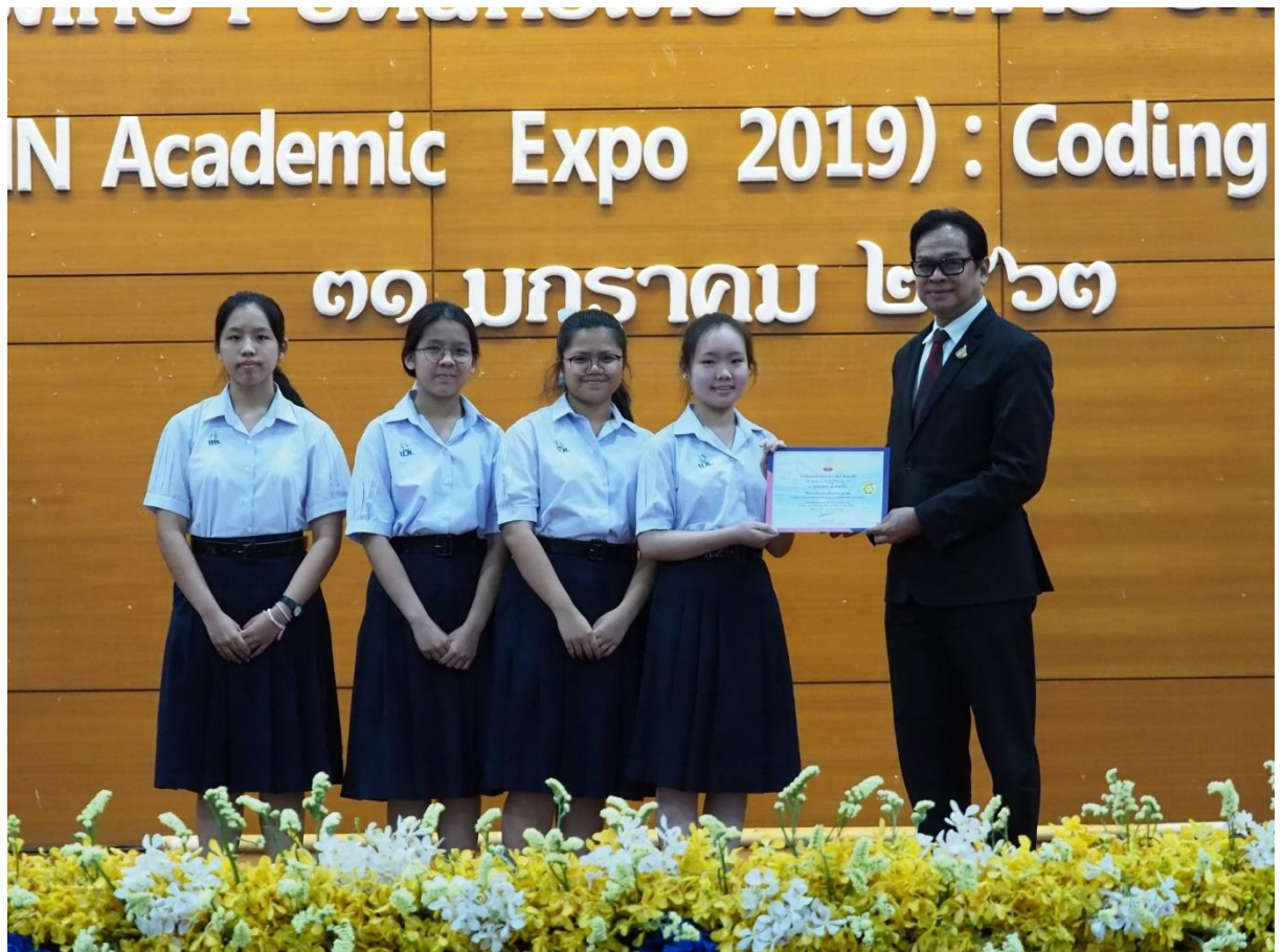
ประธานในพิธีมอบเกียรติบัตรการประกวดโครงงาน PBL และการประกวดโปสเตอร์ โครงงาน PBL