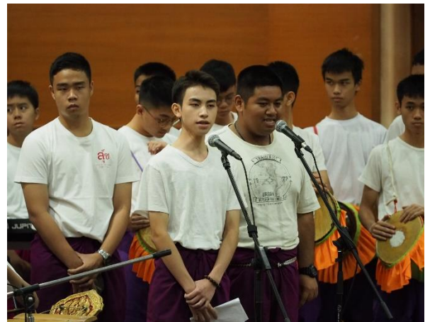
การแสดงพิธีเปิด ชุด "บดินทรเดชา เทิดไท้ รักรัษศิลป์ แผ่นดินทอง"