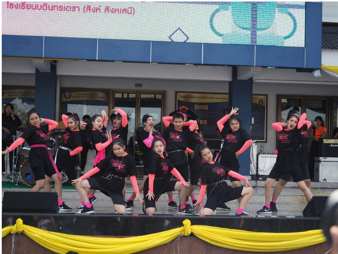
การแสดงเต้น cover dance ณ ลานสโรชนิลุบล หน้าอาคาร 1