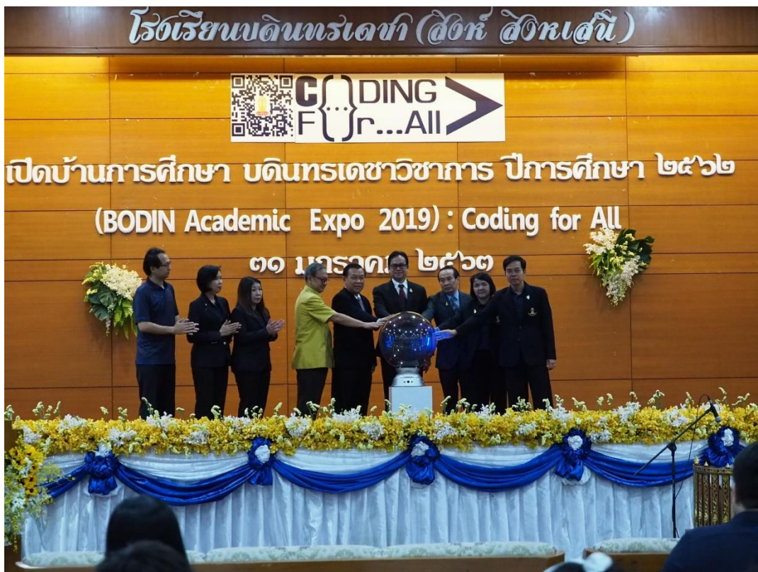
ประธานในพิธี คณะผู้บริหารโรงเรียนบดินทรเดชา (สิงห์ สิงหเสนี) และแขกผู้มีเกียรติ ร่วมเปิดงานฯ