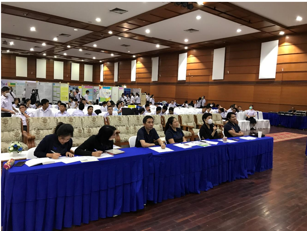
การนำเสนอโครงการด้วยวาจา สาขาสวนพฤกษศาสตร์โรงเรียน