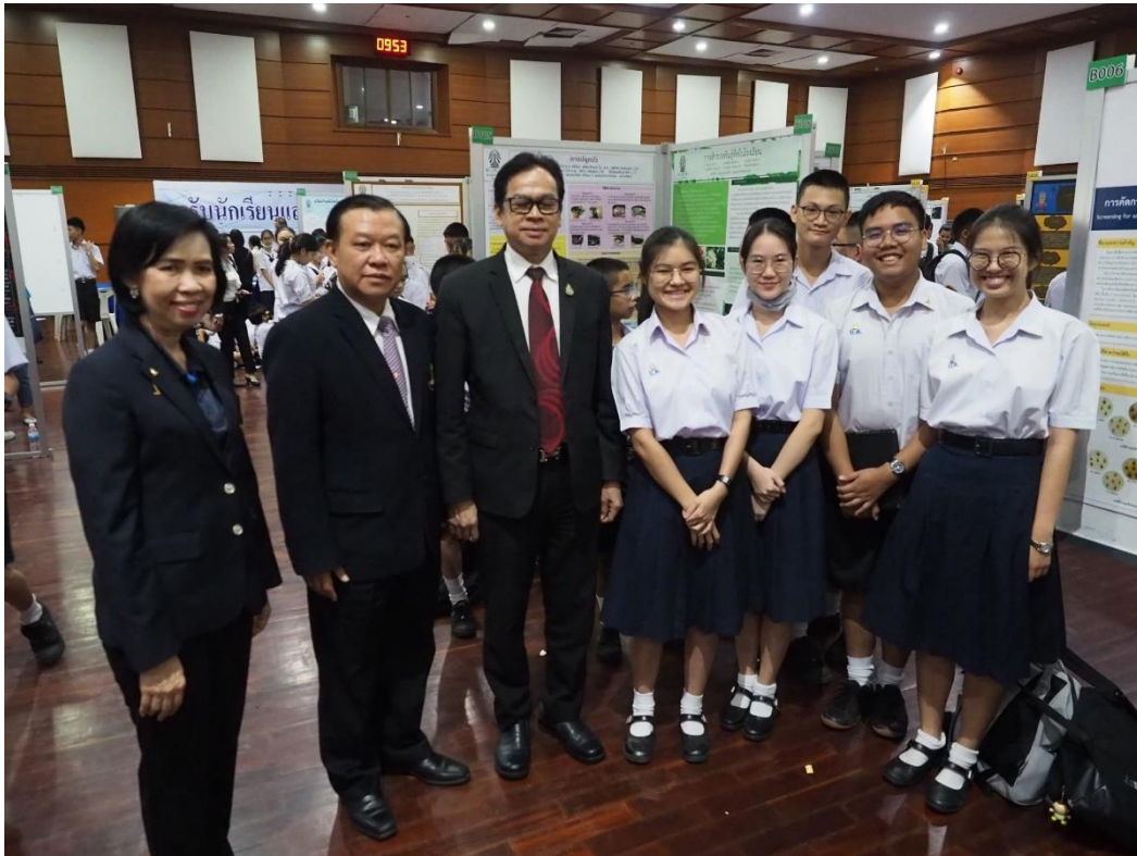
ประธานในพิธีและแขกผู้มีเกียรติเยี่ยมชมการแสดงผลงานของนักเรียน ณ หอประชุมบดินทรพิพัฒน์