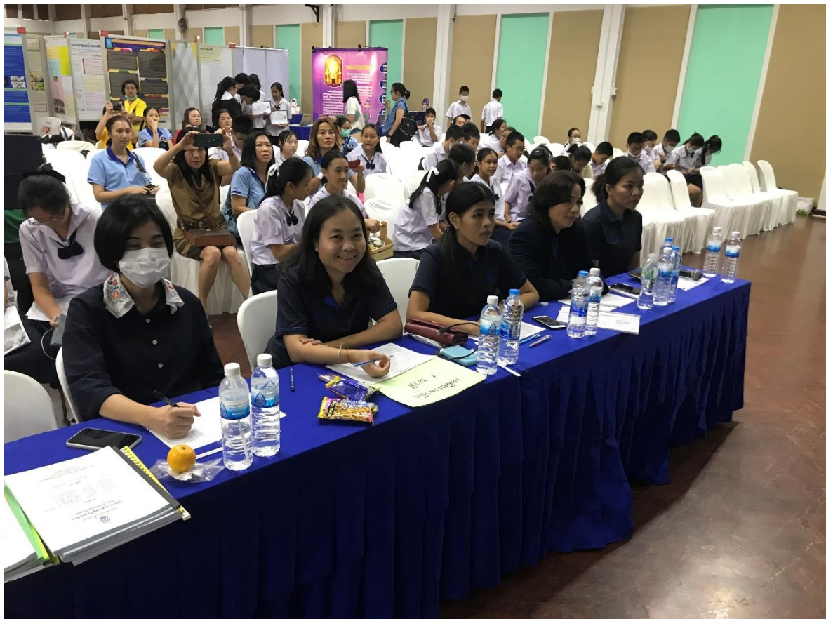
การนำเสนอโครงการด้วยวาจา สาขาหลักปรัชญาของเศรษฐกิจพอเพียง