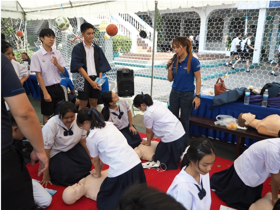
กิจกรรมของกลุ่มสาระการเรียนรู้และกลุ่มงานต่างๆ เพื่อให้นักเรียนเข้าร่วม