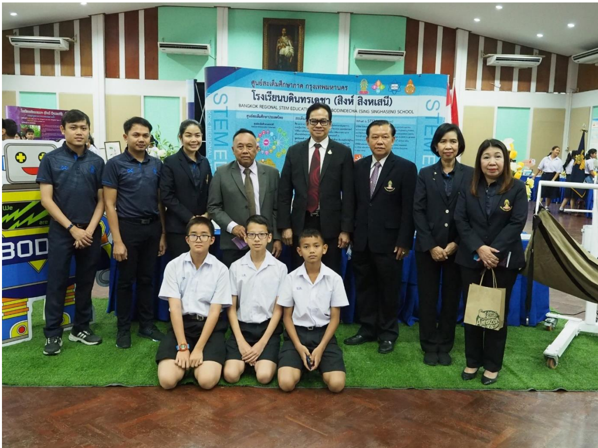
ประธานในพิธีและแขกผู้มีเกียรติเยี่ยมชมการแสดงผลงานยอดเยี่ยม (Best practice)

ของกลุ่มสาระการเรียนรู้และกลุ่มงานต่างๆ ณ หอประชุม อาคารเฉลิมพระเกียรติ ชั้น 2