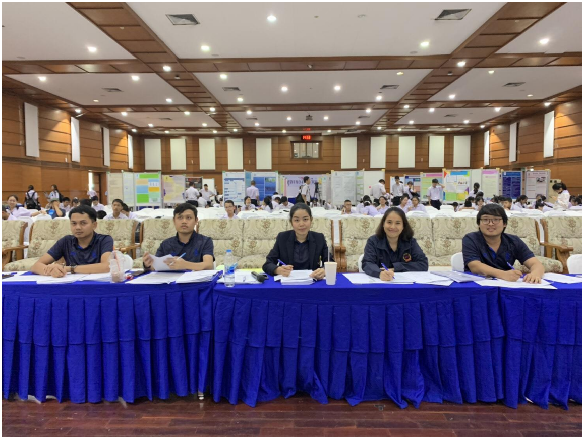
การนำเสนอโครงการด้วยวาจา สาขาสะเต็มศึกษา