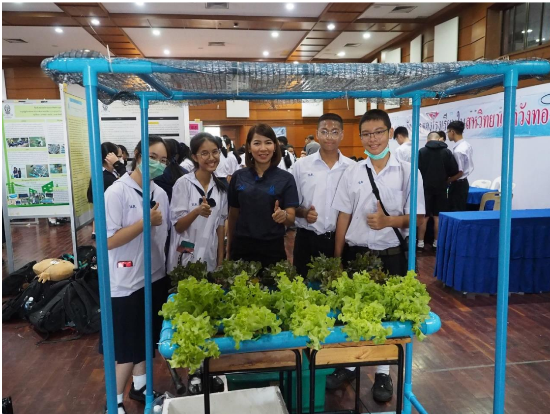
ผลงานของนักเรียนที่เกิดจากการทำโครงการ PBL