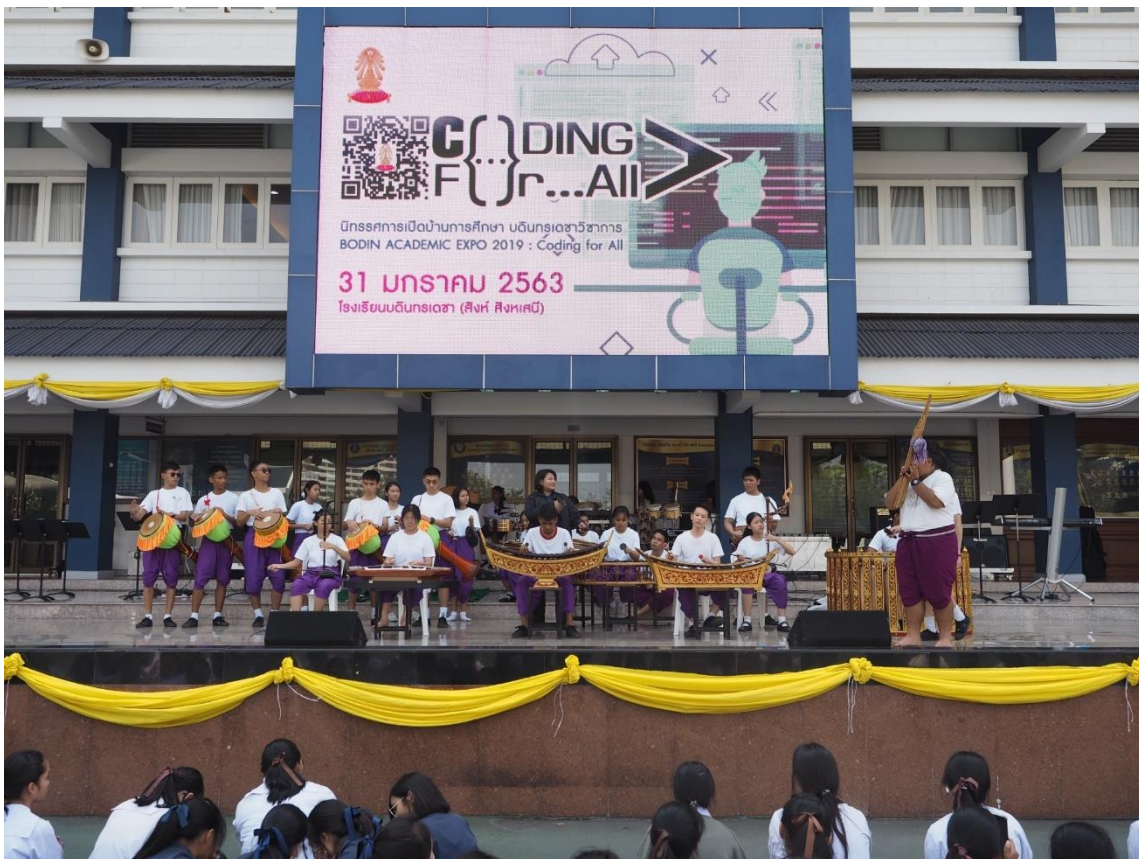
การแสดงความสามารถทางด้านดนตรีไทย ณ ลานสโรชนิลุบล หน้าอาคาร 1