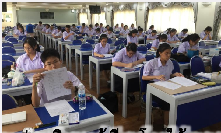
การวัดและประเมินผลผู้เรียนโดยใช้แบบทดสอบ