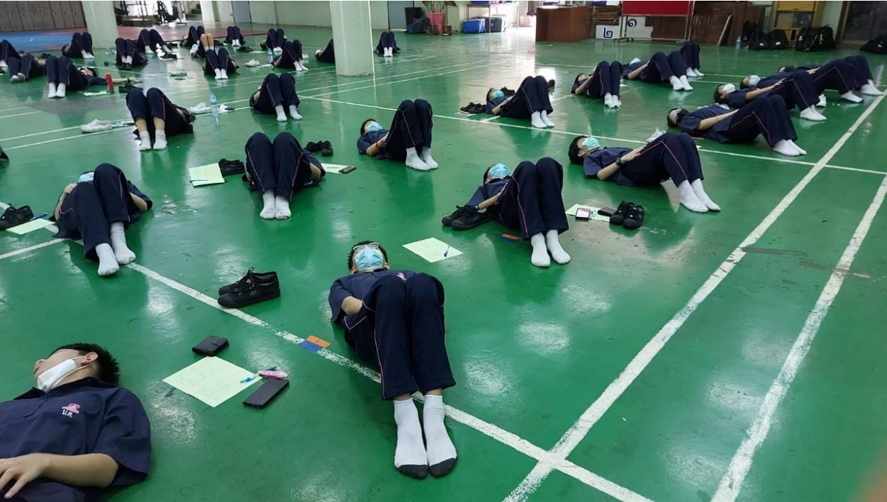
การทดสอบสมรรถภาพทางกายในสถานการณ์การแพร่ระบาดของโรคติดเชื้อไวรัสโคโรนา 2019 (Covid-19)