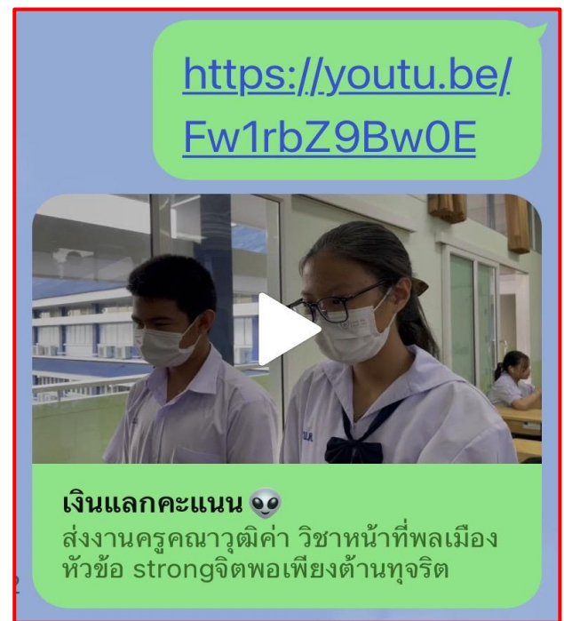
Link คลิปที่ 3 https://youtu.be/Fw1rbZ9Bw0E