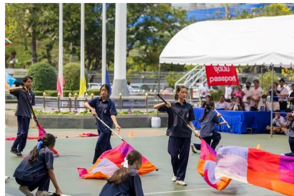
ภาพประกอบ : กิจกรรมเปิดบ้านการศึกษา บดินทรเดชาวิชาการ ปีการศึกษา 2566