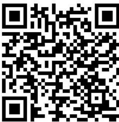
แนวทางการประเมินตนเอง ปีการศึกษา ๒๕๖๖

หัวหน้ามาตรฐานสามารถศึกษาเล่มแนวทางการประเมินตนเองของสถานศึกษา ปีการศึกษา ๒๕๖๖ รูปแบบออนไลน์ได้จากเว็บไซต์งานประกันคุณภาพการศึกษา หรือดาวน์โหลดไฟล์ .docx ได้จาก QR-Code ดังแนบ