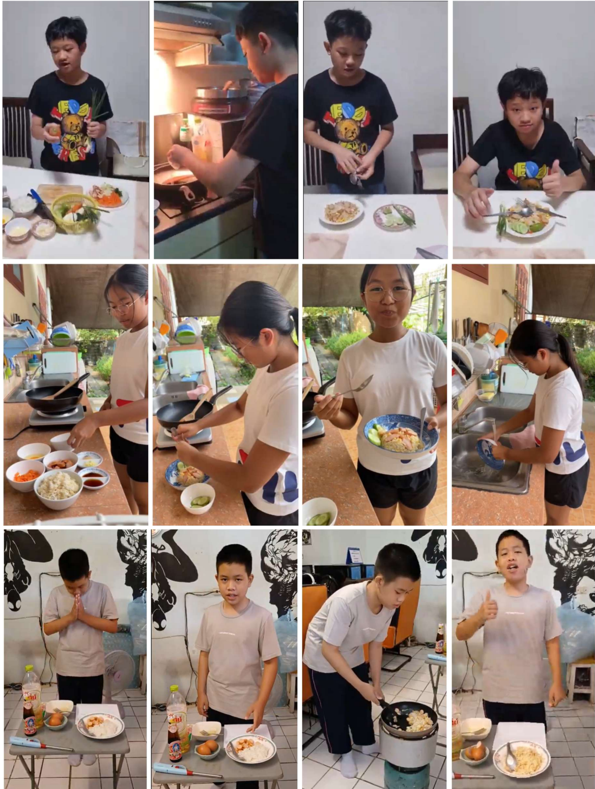
คลิปวิดีโอสาธิตการประกอบอาหารจานเดียวอย่างง่าย โดยใช้กระบวนการทำงาน 4 ขั้นตอน

การออกแบบและจัดกิจกรรมการเรียนการสอนแบบ Active Learning กระตุ้นให้ผู้เรียนได้เรียนรู้ด้วยตนเองและฝึกทักษะชีวิต โดยกำหนดภาระงานที่ให้ผู้เรียนเป็นผู้ลงมือปฏิบัติด้วยตนเอง ประเมินผลงาน และปรับปรุงผลงานของตนเองได้อย่างต่อเนื่อง