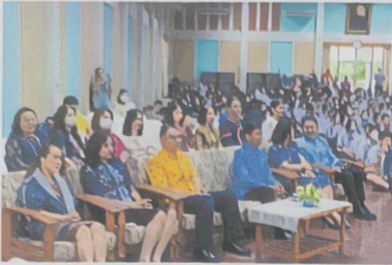
ภาพผู้บริหาร ครู และนักเรียนร่วมแต่งกายด้วยชุดไทยเข้าร่วมในกิจกรรม