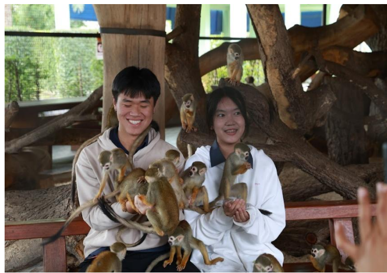
ภาพประกอบ : กิจกรรมทัศนศึกษา ระดับชั้นมัธยมศึกษาปีที่ 5 ณ วัดไชยวัฒนาราม และศรีอยุธยาไลอ้อนปาร์ค จังหวัดพระนครศรีอยุธยา ปีการศึกษา 2567