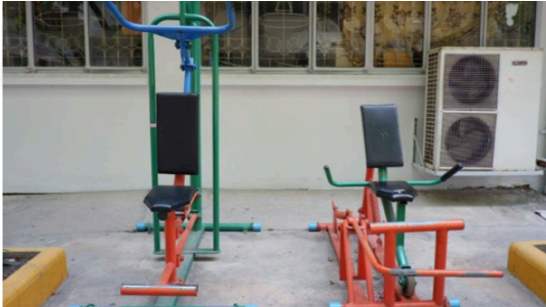
อุปกรณ์ออกกำลังกาย