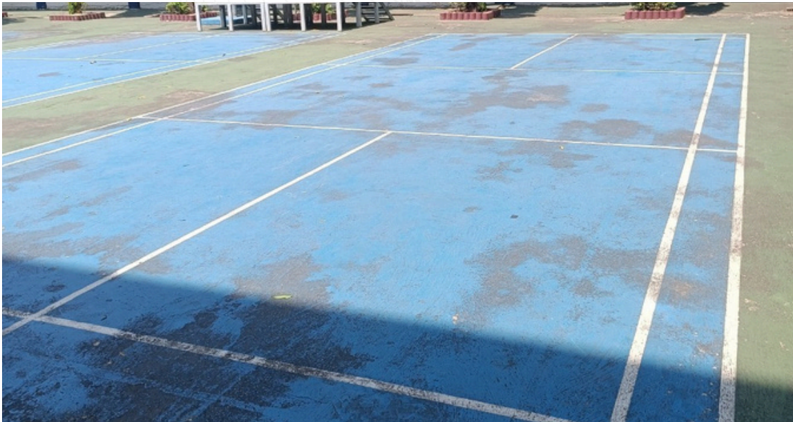
สนามแบดมินตันกลางแจ้ง