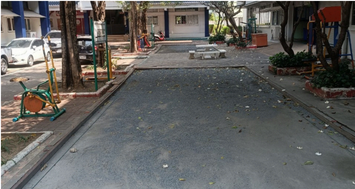
สนามเปตอง