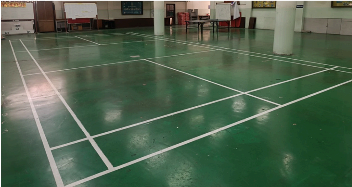
สนามแบดมินตัน