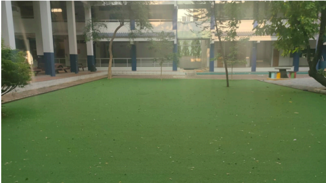
สนามหญ้าเทียม