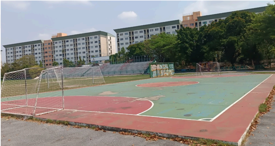
สนามฟุตบอล