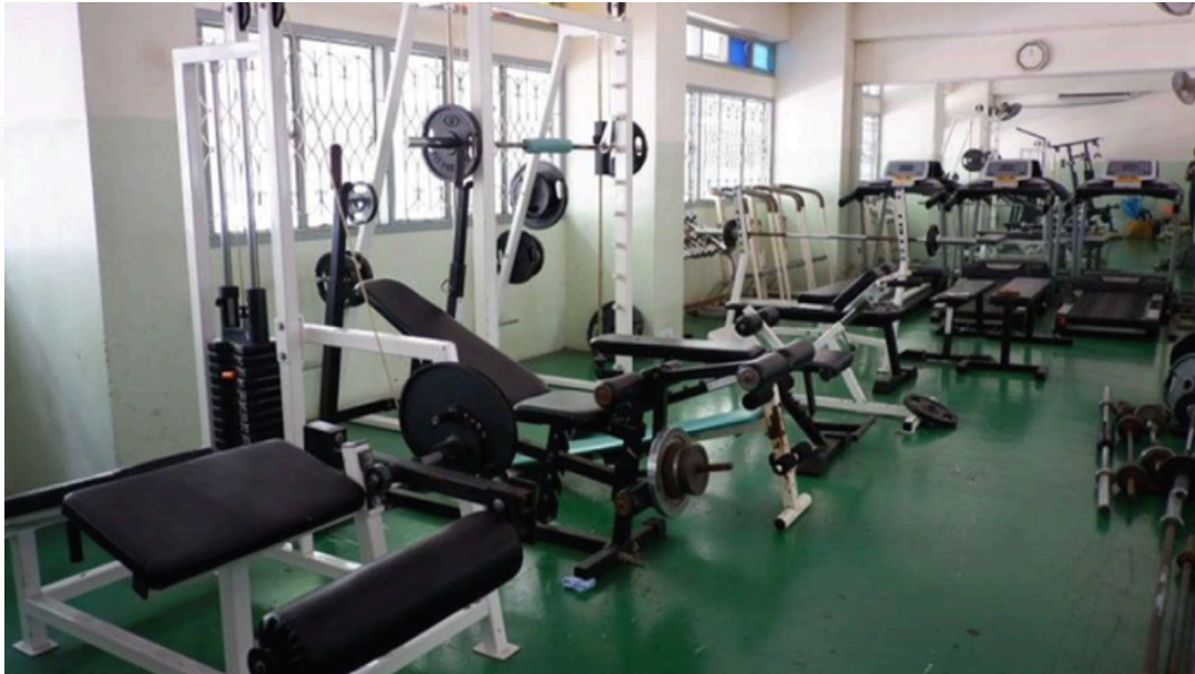
ห้องพัฒนาสมรรถภาพทางกาย