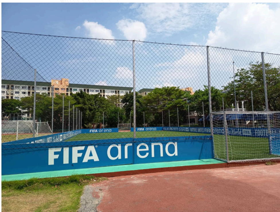
สนามหญ้าเทียม FIFA ARENA