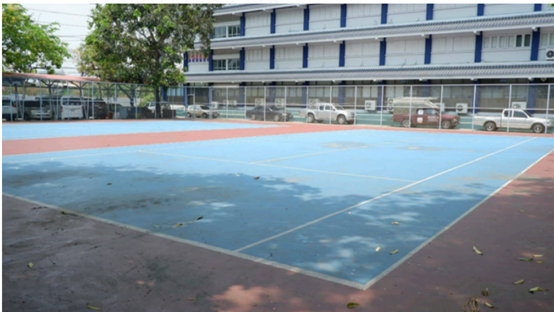
สนามเทนนิส