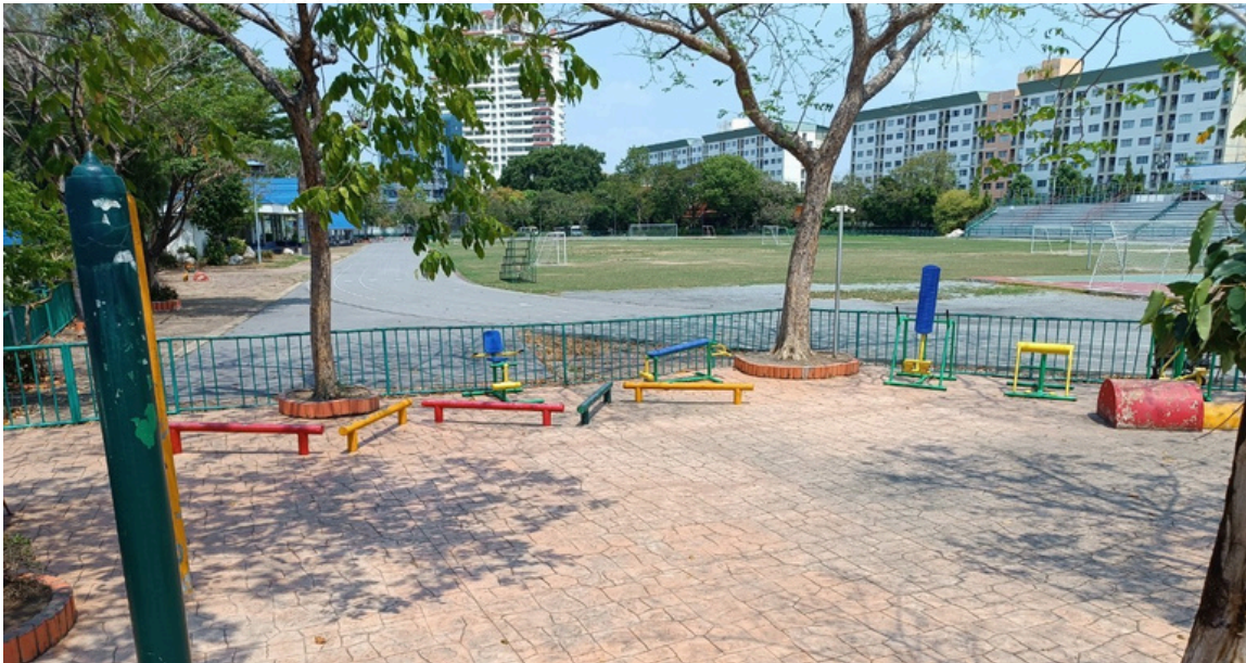
ลานออกกำลังกาย