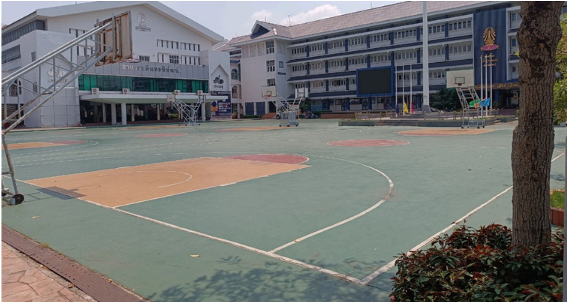
สนามบาสเกตบอล