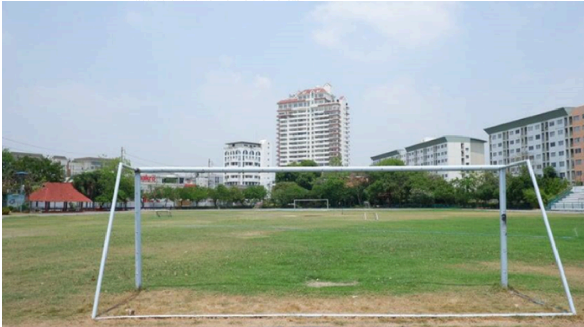
สนามฟุตบอล