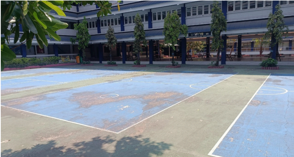
สนามตะกร้อ